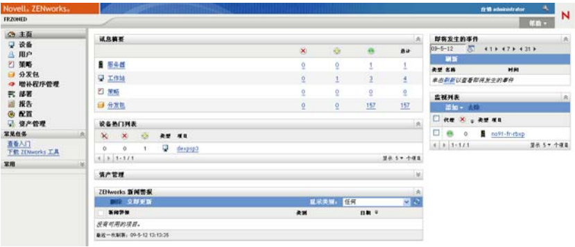
图 1-2 ZENworks 控制中心

ZCC 安装于“管理区域”中的所有“主服务器”上。您可以在任意一个“主服务器”上执行所有管理任务。由于 ZCC 是基于万维网的管理控制台，因此它可以从任意支持的工作站访问。